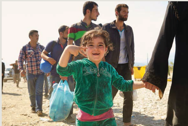
▲ Op de vlucht.